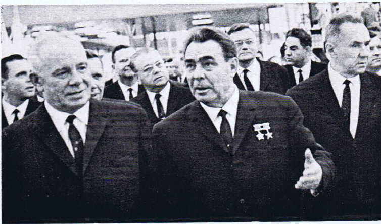
Die Troika Podgorny — Breschnew — Kossygin (zu: Umbesetzung in Moskau, S. 54)